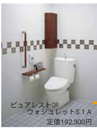
ピュアレストQR ウォシュレットS1A 定価192,300円