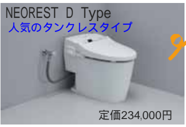
NEOREST D Type 人気のタンクレスタイプ 定価234,000円