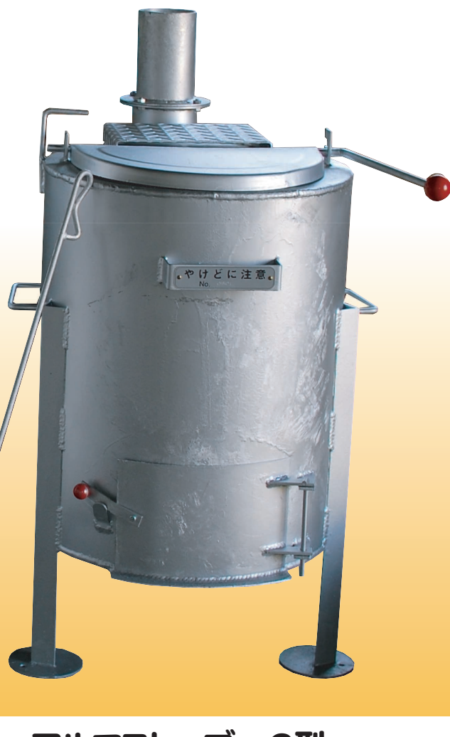
アルマストーブ 2型