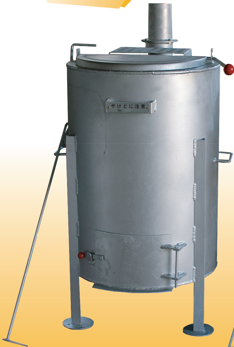
アルマストーブ 3型